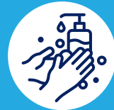
Lavez vos mains