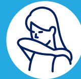
Toussez dans votre coude

Le port du masque est obligatoire lors d'une consultation.