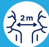
Gardez vos distances