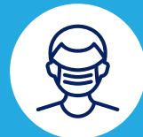
Portez un masque