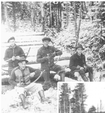
1940. Affûtage de scies