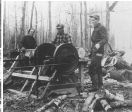
1946. Sciage de bois