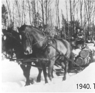
1940. Transport du bois