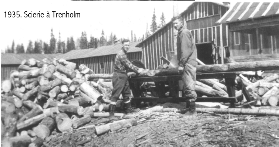
1935. Scierie à Trenholm