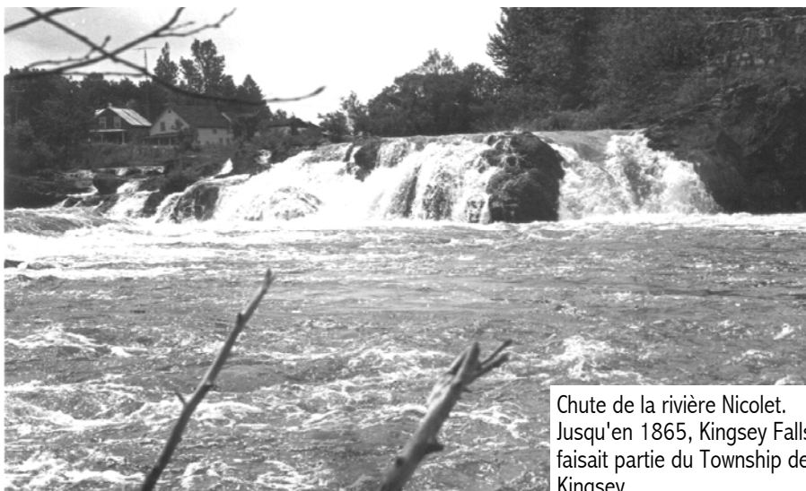
Chute de la rivière Nicolet. Jusqu'en 1865, Kingsey Falls faisait partie du Township de Kingsey.