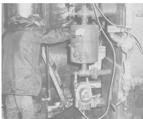
Oups! Alambic servant à la fabrication d'alcool frelaté, saisi par la GRC. en 1970.